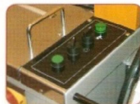
pulsantiera di facile utilizzo

Macchina reggiatrice automatica con operatore testa laterale